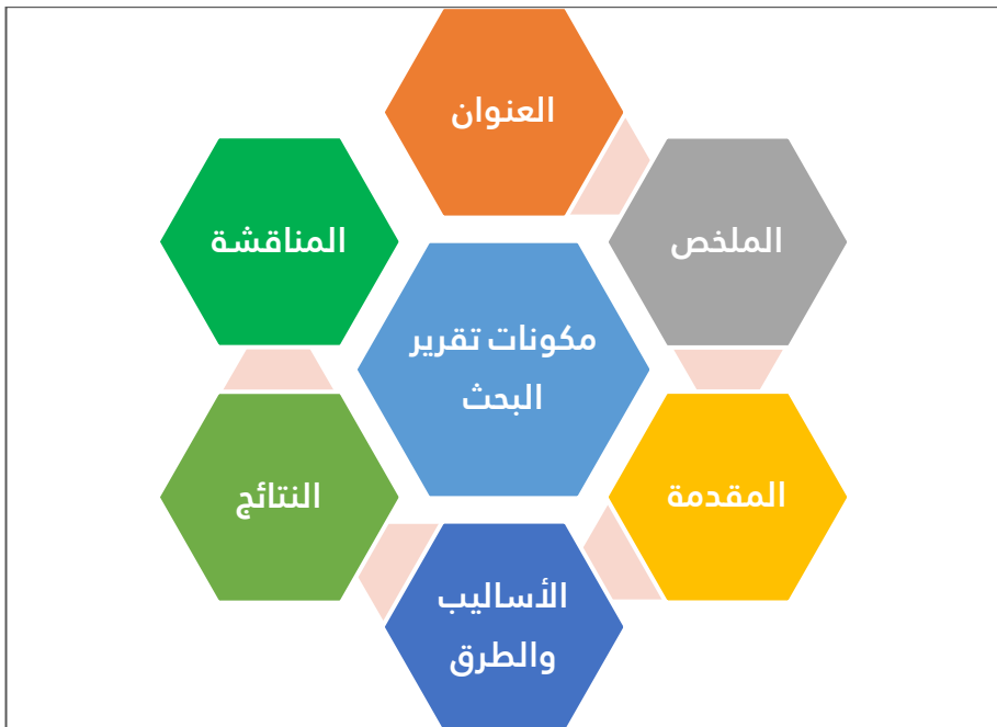
شكل (١) عناصر التقرير البحثي

والشكل التالي (شكل ١) يلخص عناصر التقرير البحثي.