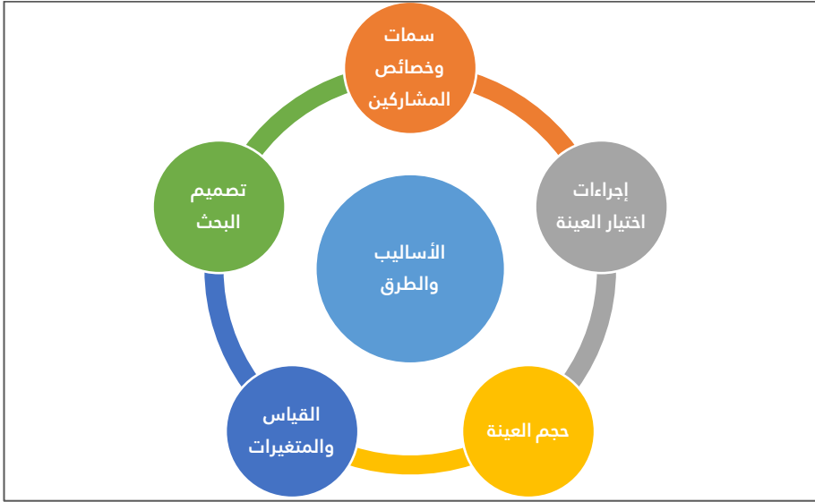
شكل (٢) عناصر الأساليب والطرق المستخدمة في التقرير البحثي

ويمكن تلخيص عناصر الأساليب والطرق المستخدمة في التقرير البحثي في الشكل التالي: